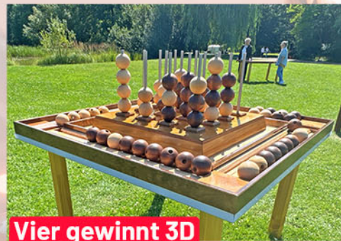
Vier gewinnt 3D